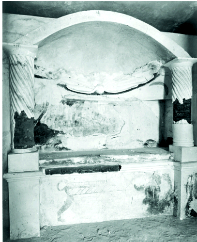
ABB. 5 Tuna el-Gebel, Grabnische in Grabhaus M 1

Während in Griechenland seit archaischer Zeit auf Kline gegessen, gestorben und bestattet wurde, sind entsprechende Möbel im ägyptischen Totenkult erst in hellenistischer Zeit nachzuweisen 27 . Doch zeigt uns ein Grab in der Nekropole von Tuna el-Gebel in Mittelägypten, wie in der Kaiserzeit ägyptische und griechische Traditionen miteinander verschmolzen (ABB. 5). Den Grabungsberichten zufolge wurde in einer Nische ruhend die Mumie einer jungen Frau gefunden, die nach den Inschriften des Grabes als Isidora zu benennen ist 28 . Interessanterweise ist auf dem Podest ein ägyptisches Einbalsamierungsbett aufgemalt, welches somit der Szenerie