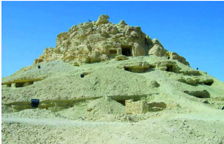
ABB. 3 Ansicht des Gräberberges (Gebel el-Mawta) in der Oase Siwa

Seltener sind oberirdische Bauten aus Stein oder Ziegeln wie in den mittelägyptischen Orten Tuna el-Gebel (ABB. 4) und Antinoupolis sowie in der Oase Charga (ABB. 7) 19 . Anders als die einfachen Gruben im Fayyum stehen diese architektonisch aufwendigen Anlagen in der Tradition der Grabstätten des Neuen Reichs. Auch die oft belegte Dekoration in Relief oder Malerei knüpft an die älteren thebanischen Vorbilder an. Im oberägyptischen Theben selbst wiederum nutzte man in römischer Zeit die pharaonischen Anlagen weiter, wie die Soter-Familie zeigt, deren Mumien in einem Grab des 13. Jhs. v. Chr. bestattet wurden 20 .