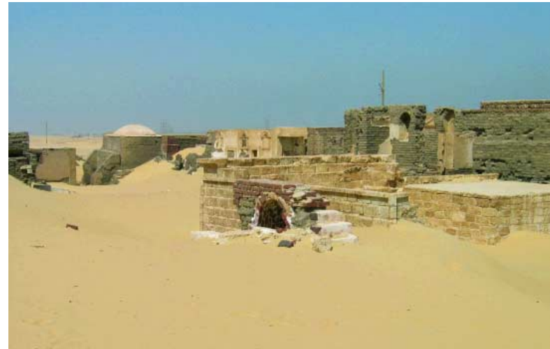
ABB. 4 Ansicht der Nekropole von Tuna el-Gebel in Mittelägypten

Auf Grundlage der hier vorgetragenen Skizze könnte schnell der Eindruck entstehen, daß im kaiserzeitlichen Ägypten ein rein ägyptischer Totenkult ausgeübt wurde. Zwar ist nicht von der Hand zu weisen, daß selbst in Alexandria »ad Aegyptum« (»bei Ägypten«) unter römischer Herrschaft die Mumifizierung unter Einwanderern verbreitet war und in den Gräbern ägyptische Motive verstärkt erscheinen. Auf der anderen Seite sollte man die Vielfalt der Bedeutungsebenen berücksichtigen, die sich in einer multikulturellen Gesellschaft wie der ägyptischen ergeben können. Auch wenn der Kaiser nominell dieselben Titel wie die Pharaonen vor ihm trug, darf dieser Tatsache kaum dieselbe Bedeutung zugemessen werden. In einer Zeit, in der Heilsreligionen die Menschen im gesamten Imperium Romanum faszinierten, bot das Mysterium des ägyptischen Toten-