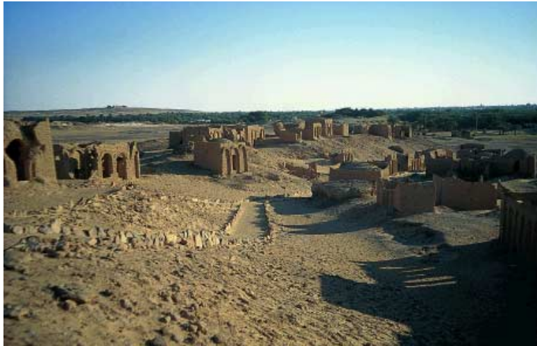
ABB. 7 Oase Charga, Nekropole von Bagawat

Die Stoffe dienten in diesem Fall also dazu, eine reale Umgebung zu schaffen, während Erosen und Clipeus dem Bereich der Illusion zuzuordnen sind. Eine Verbindung von Wirklichkeit und Täuschung wird der Inszenierung insgesamt zugrunde gelegen haben: Es geht um die ewige Aufbahrung (prothesis) der Verstorbenen, die in der offen zur Schau gestellten Mumie der Isidora in Grabhaus M 1/CP Gestalt angenommen hat (ABB. 5). Zur Inszenierung treten zuweilen auch Inschriften, die die Toten heroisieren 40 .